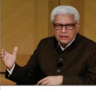
جاوید احمد غامدی صاحب