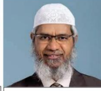
ڈاکٹر زاکیر نایک صاحب

یوٹیوب پر ان علماء کرام کے بیانات ضرور سنا کریں۔