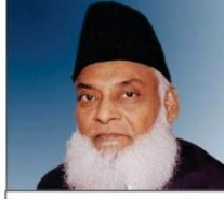
ڈاکٹر اسرار احمد صاحب