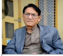
پروفیسر امیر رفیق اختر صاحب