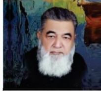
بابا عرفان الحق صاحب