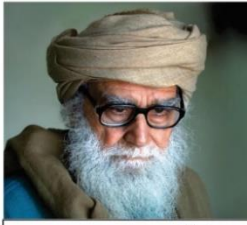
مولانا وحید الدین خان صاحب