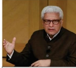
جاوید احمد غامدی صاحب