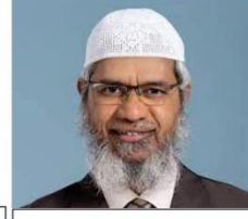
ڈاکٹر ذاکر نایک صاحب

یوٹیوب پر ان علماء کرام کے بیانات ضرور سنا کریں۔