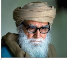
مولانا وحید الدین خان صاحب