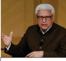
ڈاکٹر جاوید احمد غامدی صاحب